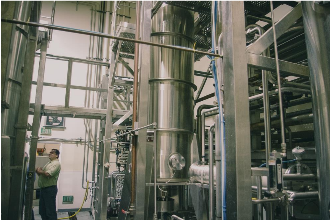
De roterende kegelkolom bij TFC/Conetech

smaken,' zei Scott Burr, destijds hoofdwinmaker van Conetech, 'dus door het weg te halen, komt naar voren wat er werkelijk is. Het voegt ook zoetheid toe aan de smaak.' Het is deze zoetheid die ontbreekt in het monster met 4% alcohol, en die de zuurgraad versterkt.