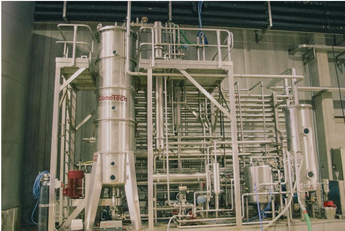
De roterende kegelkolom bij Torres

koolstofdioxide geproduceerd worden dan bij de tweede fermentatie van mousserende wijn volgens de traditionele methode, en zouden de flessen letterlijk bommen worden.