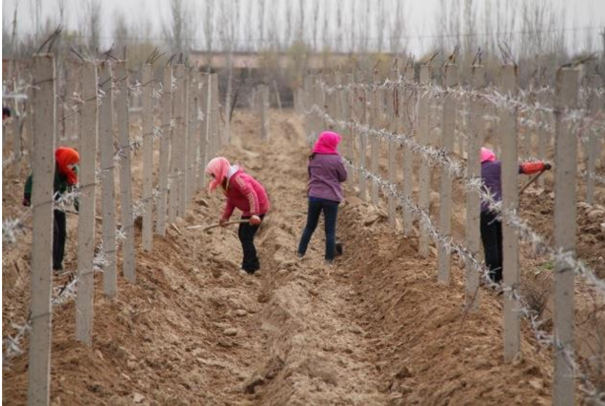
Arbeiders begraven wijnranken voor de winter, provincie Ningxia, Noordwest-China

Verteld door Academy Award©-winnaar Russell Crowe en gefilmd voor het grote scherm met de nieuwe Arri Alexa-camera's, volgt Red Obsession een moderne zijderoute door de lens van de etherische wijnen van Bordeaux. De film observeert de buitengewone financiële risico's die mensen bereid zijn te nemen in hun streven naar hun passie. Het confronteert de moderne dilemma's waarmee de wijnboer van Bordeaux wordt geconfronteerd in een tijd van grote wereldwijde onzekerheid, waar één verkeerde beslissing een reputatie die in honderden jaren is opgebouwd, op het spel kan zetten. En in deze "Aziatische eeuw" confronteert de film onze vooroordelen en gemakkelijke stereotypering van andere gebruiken en tradities. Tegen de achtergrond van de adembenemende landschappen van Bordeaux en China vertelt Red Obsession het verhaal van twee uiteenlopende en krachtige culturen die elkaar vinden in hun liefde voor een delicate wijn.